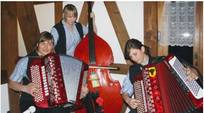
Ländlermusik ist längst keine Männersache mehr.

In Uri findet sich eine sehr lebhaft und abwechslungsreiche Ländlermusikszene. Schätzungsweise hundert Formationen sind hier aktiv, vom Handorgelduett über das Ländlertrio bis hin zur Kapelle. Rund 70 Formationen sind in der Urner Sektion des Verbands Schweizer Volksmusik organisiert. Sie spielen alles, vom Innerschwyz- oder Schwyz-örgeli-Stil bis hin zu neuer Volksmusik. Am häufigsten finden sich in Uri jedoch Formationen mit Kontrabass, Klavier, Handorgel und Klarinette, die sich dem Innerschwyz-Stil verschrieben haben. Die bekannteste Urner Ländlermusikformation war «Echo vom Kinzig», ein Ländlertrio, das während rund 60 Jahren erfolgreich – auch im Ausland bis nach Alaska – unterwegs war und einen eigenen, von Musikliebhabern sofort erkennbaren Stil pflegte.