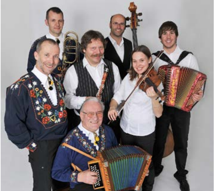
Einige der bekanntesten Urner Volksmusiker