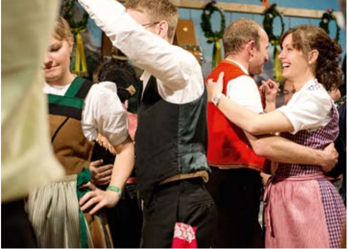
Der Trachtentanz wird auch von den Jungen nach wie vor gepflegt.

alternierend damit stattfindende, ebenso authentische «Volksmusikfestival Altdorf», das eine umfassende Sicht auf die aktuelle Volksmusikszene in der Schweiz bietet, stehen bei jungen und älteren Formationen wie auch bei der Bevölkerung und den zahlreichen Gästen aus dem In- und Ausland hoch im Kurs und fix in der Agenda.