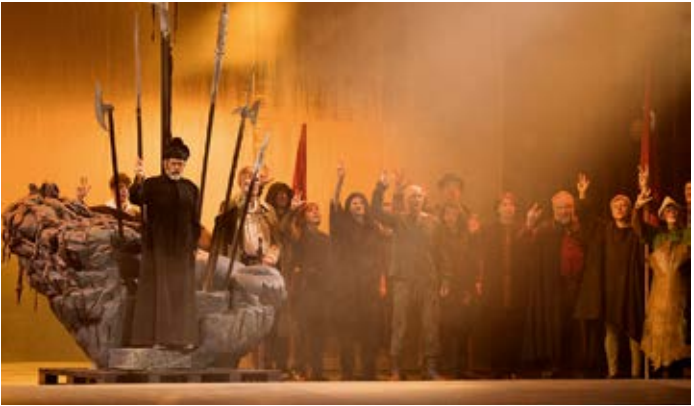
Altdorfer Tellspiele 2016

Oper, Drama, Stummfilm, Hörspiel oder als Musical, die Geschichte des Schweizer Freiheitskämpfers (S. 12) vermag auch heute noch ein grosses Publikum zu begeistern. Die bekannteste aller Fassungen und Formen ist jedoch das Drama «Wilhelm Tell» von Friedrich Schiller. Es ist das letzte fertiggestellte Bühnenstück des deutschen Dichters und Historikers. Die Idee dazu lieferte ihm sein Freund Johann Wolfgang von Goethe. Und obwohl Schiller selber die Schweiz nie besucht hatte, treffen die Beschreibungen und Ortsangaben in seinem Stück bemerkenswert genau zu. 1804 fand die Uraufführung des Telldramas unter Goethes Regie im Hoftheater in Weimar statt. Das Stück wurde begeistert aufgenommen. Noch im selben Jahr wurde das Schauspiel in Luzern von einer deutschen Wandertruppe aufgeführt. Hier hielt sich die Begeisterung jedoch in Grenzen. Auch auf den Berufstheater-Bühnen in Zürich vermochte das Spiel nicht zu überzeugen. Das Drama gehörte in der Schweiz eindeutig auf die Volksbühne: Mit Aufführungen unter anderem in Gisikon, Huttwil, Stäfa, Zweisimmen, Belp und Altstetten entwickelte sich das Theaterspiel schliesslich nach der Gründung des Bundesstaates zu einem eigentlichen Hit.