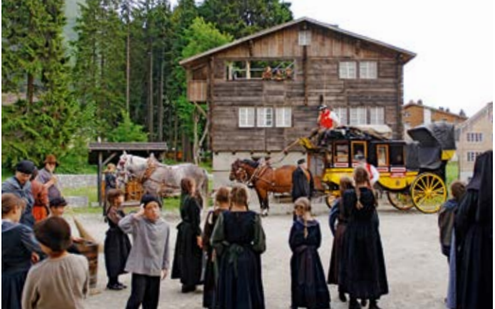
Freilichtspiele «D'Gotthardposcht» in Andermatt